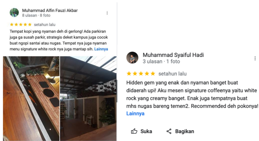
Gambar 1.2 Ulasan Dugg Coffee

Dugg Coffee. Hal tersebut dapat dilihat dalam ulasan Dugg Coffee di google review sebagai berikut.