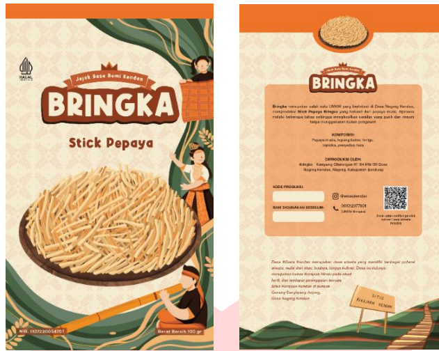
Gambar 6. Label kemasan stick pepaya Bringka