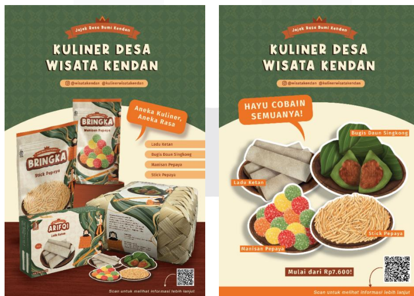
Gambar 14. Flyer