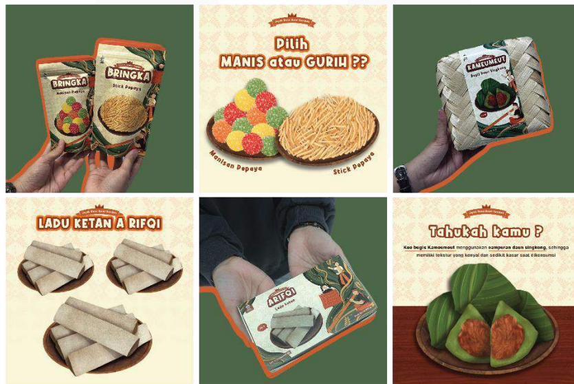
Gambar 16. Postingan sosial media