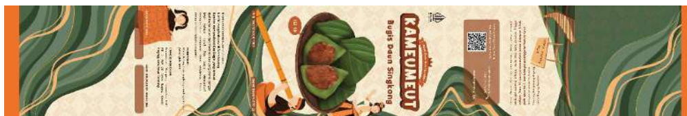
Gambar 8. Label kemasan bugis daun singkong Kameumut