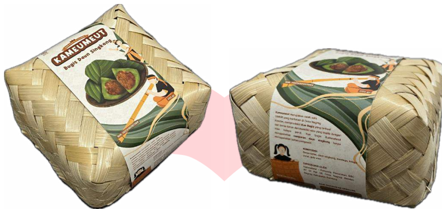
Gambar 13. Mockup kemasan bugis daun singkong Kameumeut

Produk bugis daun singkong akan menggunakan kemasan besek yang sudah dipakai oleh UMKM Kameumeut, sehingga untuk perancangannya berfokus pada label kemasaannya dengan ukuran 43 cm x 7 cm mengelilingi kemasan, serta menggunakan material kertas art paper sekitar 150 gsm.