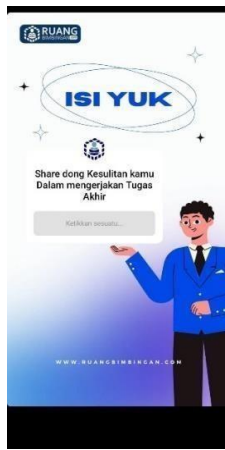
Gambar 5 Konten Connection