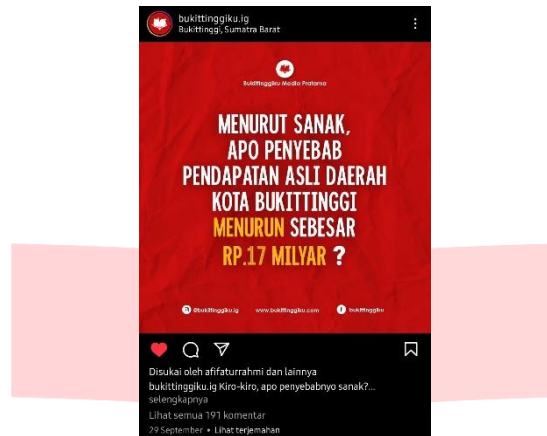
Gambar 1. 1 Konten Instagram @bukittinggiku.ig

kriminal tetapi juga wisata, festival, promosi produk, sarana untuk melaporkan suatu hal, hingga konten menarik seperti konten berbudaya dan giveaway . Hal yang menarik adalah @bukittinggiku.ig mengemas konten dengan menarik berupa menerapkan nilai kebudayaan minangkabau pada konsep dan konten instagram yang mereka sajikan. Kebudayaan Minangkabau adalah kebudayaan yang berkembang di Sumatera Barat yang salah satu kotanya adalah Kota Bukittinggi. @bukittinggiku.ig dengan tagline sebagai pusat informasi terkini dan terpercaya, @bukittinggiku.ig memanfaatkan unsur kebudayaan yang dimiliki oleh masyarakat bukittinggi dalam membangun brand image yang unik dimata followers .