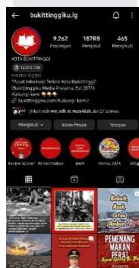
Gambar 4. 2 Profil Akun Instagram @bukittinggiku.ig

Analisis unsur-unsur instagram pada @bukittinggiku.ig yaitu Username , penamaan @bukittinggiku.ig merupakan penamaan yang menjurus langsung kepada tujuan yaitu mengenai bukittinggi. Visi @bukittinggiku.ig sebagai Menjadi Portal Informasi Terkini dan Terpercaya untuk Kota Bukittinggi dan Sumatera Barat, ini diupayakan dalam tagline yang dicantumkan pada biodata profil akun. Seluruh misi dan visi @bukittinggiku.ig ini dapat dilihat dari konten-konten yang disajikan seperti konten promosi usaha sebagai mendia mendukung UMKM, ikut menyuarakan aspirasi masyarakat melalui konten “laporan netijen”, mengkonfirmasi keresahan masyarakat kepada pihak yang berwajib, hingga menghadirkan informasi dengan lengkap.Tagline “Pusat Informasi Terkini dan Terpercaya” merupakan bentuk cita-cita akun tersebut untuk mewujudkan visi dan misi dari akun bukittinggiku. Hal ini sudah diterapkan dengan baik oleh @bukittinggiku.ig dengan baik berupa kepercayaan yang diterima dari masyarakat seperti lebih banyak masyarakat melaporkan langsung kepada @bukittinggiku.ig daripada pihak berwajib. Berikut Gambar 4.1 profil @bukittinggiku.ig