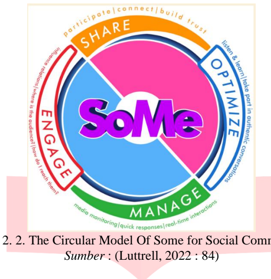
Gambar 2. 2. The Circular Model Of Some for Social Communication

bisa dimanfaatkan. Manage melakukan pemantauan secara berkala dan mengukur tindakan, dan engage menentukan cara berinteraksi dan memilih konten yang memiliki engagement yang tinggi. Berikut gambar 2.2 yang menerangkan The Circular Model of SoMe for Social Communication oleh Regina Luttrell :