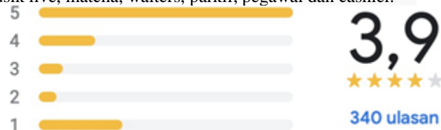
Gambar 1.3 Ulasan di Google Maps

Berdasarkan gambar 1.2 ulasan pelanggan dreams social life di google maps dengan rating 1,2 dan 3 mengarah pada pelayanan tempat, musik live, matcha, waiters, parkir, pegawai dan cashier.