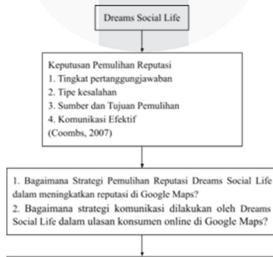
Tabel 2.2 Kerangka Pemikiran