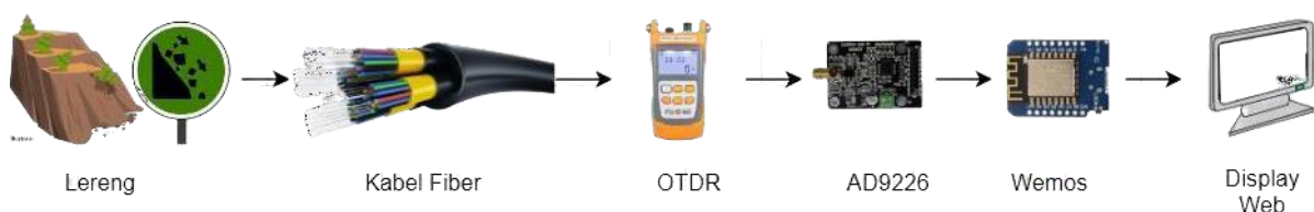
Gambar 1.2 Produk A