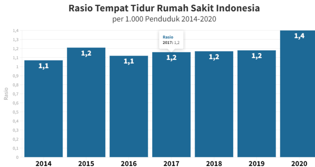
Gambar 1. 1 Rasio Tempat Tidur Rumah Sakit Indonesia