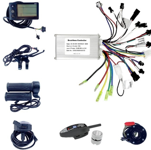
Gambar 1.1 Conversion Kit Konvensional

Wireless kontrol pada conversion kit sepeda adalah sebuah inovasi yang mengikuti perkembangan teknologi sepeda listrik di dunia. Wireless kontrol pada conversion kit sepeda juga memberikan keuntungan bagi pengguna yang ingin mengubah sepeda konvensional mereka menjadi sepeda listrik. pengguna hanya perlu memasang motor, baterai, dan modul wireless kontrol pada sepeda mereka dan menghubungkannya secara nirkabel.