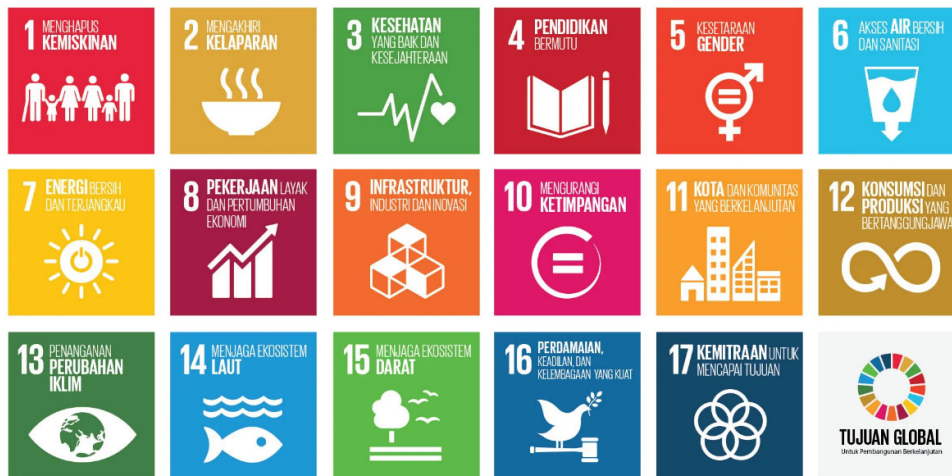
Gambar 1.2 Sustainable Development Goals

Sepeda listrik mendukung pencapaian SDGs dengan mengurangi emisi polutan dan karbon yang dihasilkan oleh kendaraan bermotor berbahan bakar fosil. Sepeda listrik juga dapat meningkatkan efisiensi energi dan menghemat biaya operasional. Selain itu, sepeda listrik dapat mendorong inovasi dan kreativitas dalam bidang teknologi dan desain.