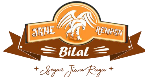
Gambar 1.1 Logo Jahe Rempah Bilal

Jahe Rempah Bilal merupakan kedai minuman rempah yang didirikan sejak 20 Desember 2020 dan terletak Jalan KH Ahmad Dahlan, Kelurahan Kerjasan, Kota Kudus (Kartika, 2022). Dilansir dari joglojateng.com, Jahe Rempah Bilal menawarkan berbagai macam menu berbahan dasar jahe yang sering diserbu konsumen. Kedai minuman jahe rempah memiliki peluang besar dalam penjualan, dikarenakan banyaknya peminat minuman jahe rempah serta sedikitnya pesaing yang membuka kedai jahe rempah (Hadi, 2022). Hasil wawancara terhadap pemilik Jahe Rempah Bilal, menyebutkan bahwa hasil penjualan rata-rata dalam sehari mampu mencapai 150 gelas minuman rempah jahe yang bervariasi (lampiran 1).