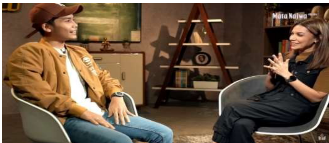
Gambar 1.2 Video Antara Najwa Shihab Dan Bintang Emon Di Media Sosial Youtube ( https://www.youtube.com/watch?v=rgP7lpn7M_E ).

negara Indonesia yang lebih baik. Jurnalis terkenal Najwa Shihab yang terkenal sangat kritis terhadap Pemerintah pernah mengundang Bintang Emon di acara yang dinamakan dengan Narasi. Diundangnya Bintang Emon pada acara tersebut telah menunjukkan bahwa Bintang Emon adalah Stand up Comedian yang memiliki pengaruh yang besar bagi para Netizen di dunia maya di Indonesia. Pada video di Youtube Najwa Shihab yang diberi judul, Bintang Emon Soal Perebutan Kekuasaan di Atas, Bodo Amat telah ditonton sebanyak 721.304 orang dan mendapatkan komentar sebanyak 578 Komentar. Video antara Najwa Shihab dengan Bintang Emon dapat dilihat pada link berikut: https://www.youtube.com/watch?v=rgP7lpn7M_E . Salah satu pembahasan yaitu mengapa Bintang Emon menggunakan media sosial seperti Tiktok untuk menyampaikan kritik terhadap Pemerintah adalah media sosial Tiktok dianggap lebih praktis, penyebaran bisa massif, dan menjangkau semua kalangan. Walaupun, penyebaran media sosial melalui Tiktok juga memiliki konsekuensi karena video tersebut bisa saja terkena UU ITE,serta dampak keamanan bagi Bintang Emon sendiri dan orang-orang terdekatnya. Gambar video antara Najwa Shihab dan Bintang Emon di media sosial Youtube dapat dilihat dibawah ini.