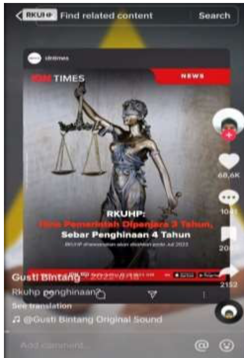
Gambar 1.4 Video Antara Najwa Shihab Dan Bintang Emon Di Media Sosial Tiktok ( https://vt.tiktok.com/ZSLLBegen/?t=1 )

Berdasarkan latar belakang tersebut, maka penelitian berfokus pada penggunaan gaya bahasa satire Bintang Emon dalam video kritiknya tentang hasil keputusan sidang atas disahkan nya RKUHP.