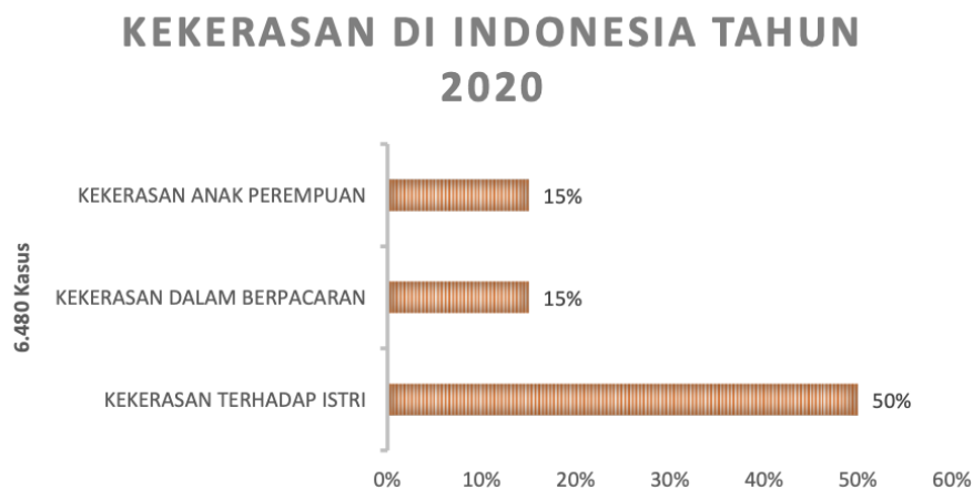
Gambar 1. 1 Kekerasan Di Indonesia Tahun 2020

Berdasarkan laporan yang tertera tanggal 5 Maret 2021 sejumlah kasus kekerasan di Indonesia tercatat pada 2020 oleh Komisi Nasional Anti Kekerasan Terhadap Perempuan mencapai 299.911 kasus. Kekerasan cenderung menonjol pada Ranah Personal (RP) mencapai 79% (6.480 kasus). Antara lain Kekerasan Terhadap Istri (KTI) peringkat terbanyak 50% (3.221 kasus), kekerasan dalam hal berpacaran 15% (954 kasus) dan peringkat ketiga kekerasan terhadap anak perempuan mencapai 15% (945 kasus) (Komnas Perempuan, 2021).