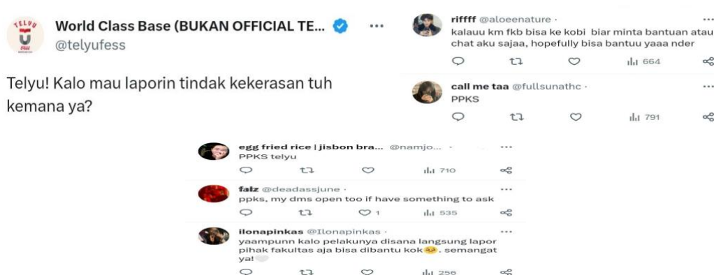
Gambar 1. 3 Laporan Kekerasan dan Permen PPKS