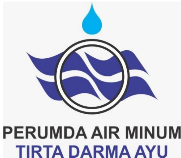
Gambar 1. 1 Logo PDAM Indramayu

Sejak tahun 1932, sistem penyediaan air minum sudah dibangun oleh pemerintah Belanda. Akan tetapi yang dapat menikmati air minum tersebut yaitu hanya kalangan tertentu seperti kalangan elit dan para penjajah Belanda. Penyerahan air minum yang diberikan Belanda kepada Indonesia (1945) yang dikelola oleh Dinas Air Minum Kabupaten Daerah Tingkat II Indramayu dan dalam pengembangan di tahun 1978 dibangun Instalasi Pengolahan Air (IPA) Berkapasitas 70 liter/detik yang dikelola oleh Badan Pengelola Air Minum (BPAM) Kabupaten Indramayu.