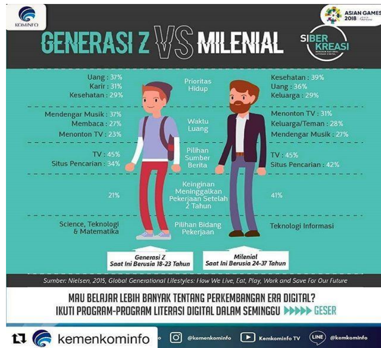
Gambar 1. 1 Perbedaan Generasi Z dan Y