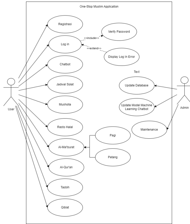
Gambar 1.1 Use Case Diagram Produk A