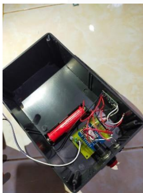
GAMBAR 2 Implementasi Alat

Pada Gambar 2 bisa dilihat penyambungan kabel menggunakan Pematrikan Lunak. Bisa dilihat alat harus tersambung dengan baterai, dikarenakan, alat ini akan bekerja jika ada energi yang disalurkan ke alat. pada kesempatan ini energi tersebut adalah baterai, dan panel surya. Ketika pagi hari hingga sore hari alat akan menggunakan energi dari sinar matahari yang di tangkap oleh panel surya. Ketika malam hari hingga ke pagi hari alat akan menggunakan baterai yang sudah terpasang. Ketika baterai sudah habis, panel surya akan mengisi daya baterai menggunakan energi sinar matahari melalui TP4056.