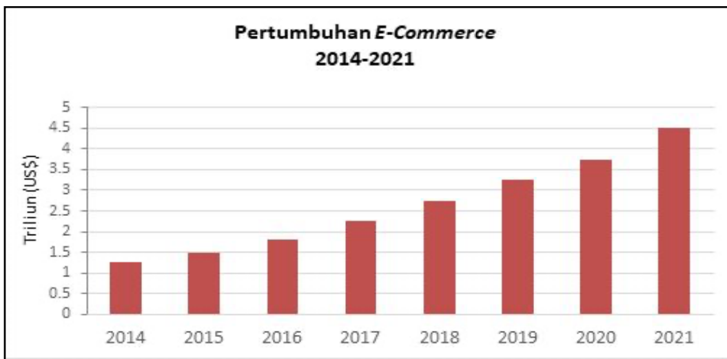
Gambar 1. 4 Pertumbuhan E-Commerce dari Tahun 2014-2021