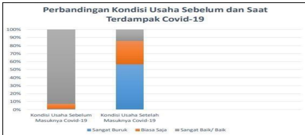
Gambar 1. 2 Data Perbandingan Kondisi Usaha Sebelum dan Saat Terdampak pandemi Covid-19

Pembatasan Sosial Berskala Besar (PSBB) diterapkan di Indonesia sebagai bagian dari respons negara terhadap wabah Covid 19. Hasil penting dari upaya kami adalah perubahan perilaku konsumen, dengan lebih banyak orang memilih melakukan pembelian pertama mereka secara online dibandingkan secara langsung. Hal ini dilakukan sebagai upaya menjaga kesehatan masyarakat umum dan perekonomian. Penerapan PSBB di masa pandemi CoV19 memberikan dampak yang signifikan. oleh masyarakat dan khususnya mereka yang bekerja pada sektor