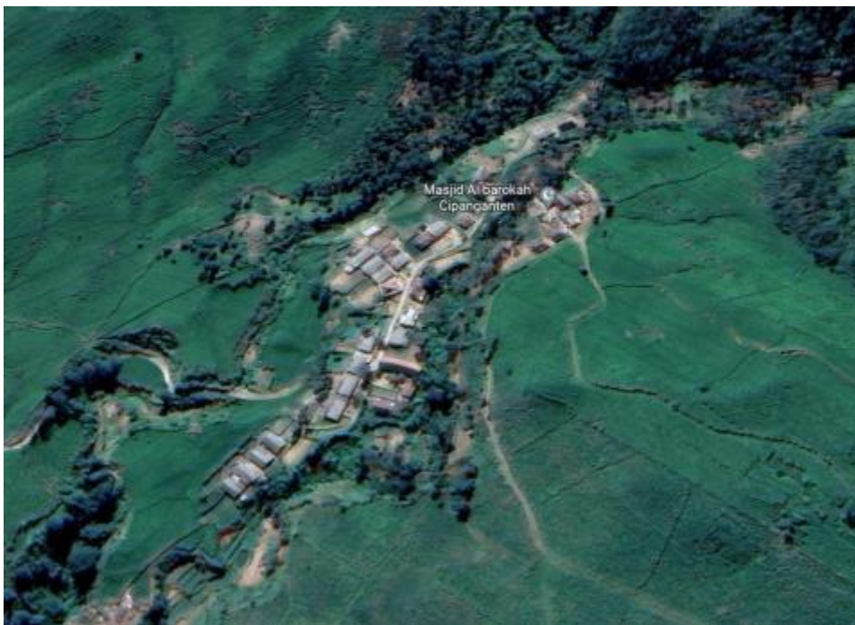
Gambar 1.1 Desa Cipanganten

Penelitian menunjukkan bahwa internet memiliki banyak manfaat, termasuk sarana komunikasi dan konektivitas, kemudahan untuk bisnis, akses informasi, pengetahuan dan pendidikan, pemetaan dan alamat, dan hiburan. Internet adalah jaringan global yang menghubungkan komputer dengan koneksi internet, setiap orang di seluruh dunia dapat berkomunikasi dan berbagi data. Saat ini, internet sangat penting untuk banyak hal. Sementara dikutip dari Kominfo.go.id. , Sekitar 15 ribu desa dilaporkan memiliki akses internet yang buruk atau sama sekali tidak dapat terhubung ke internet, yang membuat mereka menjadi tempat blankspot. [2]