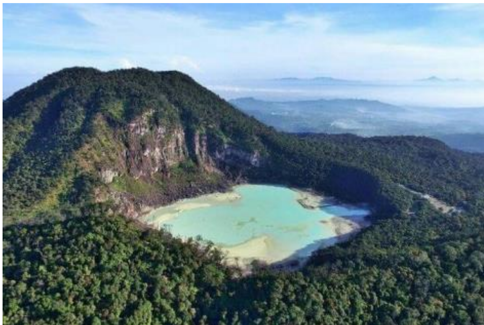
Gambar 1. 2 Gambar Gunung Patuha dan Kawah Putih

Gunung Patuha adalah gunung berubah besar yang lereng dan kakinya menjalar ke tiga desa: desa Cipanganten dan desa Sugihmukti di Kecamatan Pasotjambu dan desa Alam Endah di Kecamatan Rancabali. Namun, masyarakat lebih suka menyebutnya berada di Kawasan Ciwidey saja. [3]