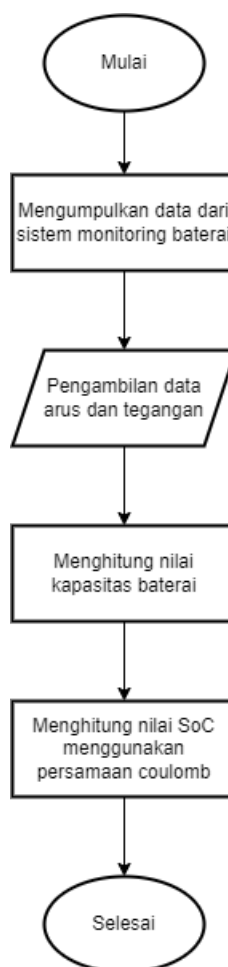
Gambar 1. 1 flowchart alur coulomb counting

Produk Estimasi SoC menggunakan metode coulomb counting ini dimulai dengan pengumpulan data terlebih dahulu dari sistem monitoring yang ada dan mengecek fungsional sistem untuk memastikan sistem berfungsi dengan semestinya. Dalam tahap pengumpulan data, data yang diambil adalah nilai tegangan dan arus. Kemudian data berupa nilai tegangan