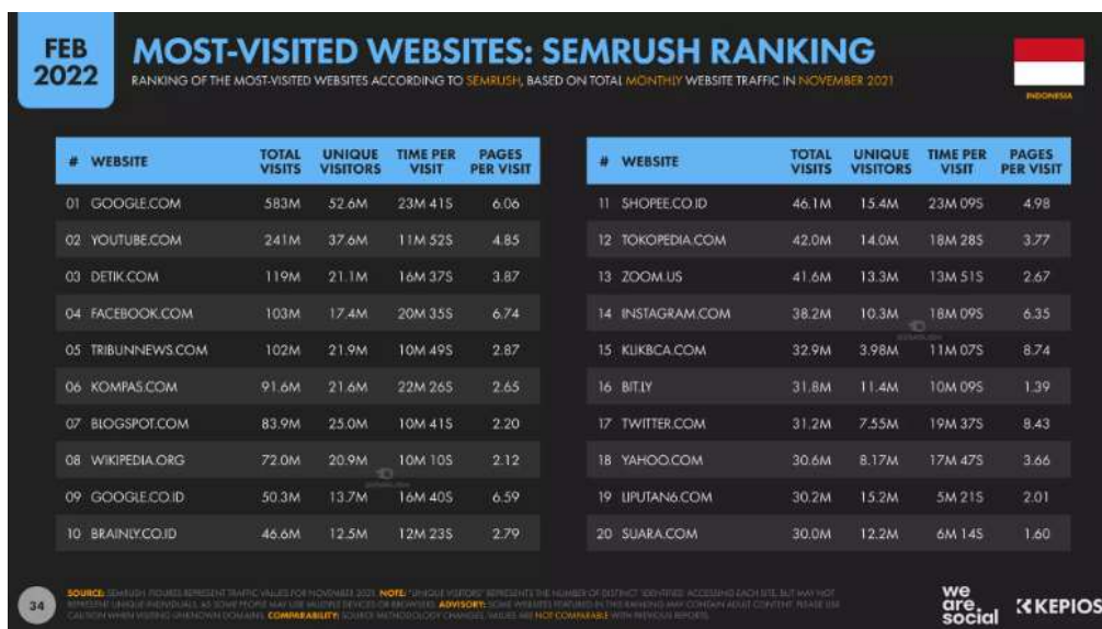
Gambar 1.1 Website yang Sering Dikunjungi Masyarakat Indonesia Tahun 2022

Berdasarkan hasil survei Hootsuite tahun 2022, diketahui bahwa platform media sosial yang paling banyak diminati masyarakat saat ini adalah Youtube. Youtube itu sendiri adalah sebuah platform media sosial dan berbagi video berbasis web yang memungkinkan penggunanya untuk menonton, membuat, dan berbagi video yang diunggah oleh banyak orang.