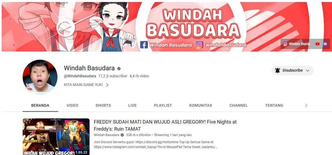
Gambar 1.2 Kanal Youtube Windah Basudara