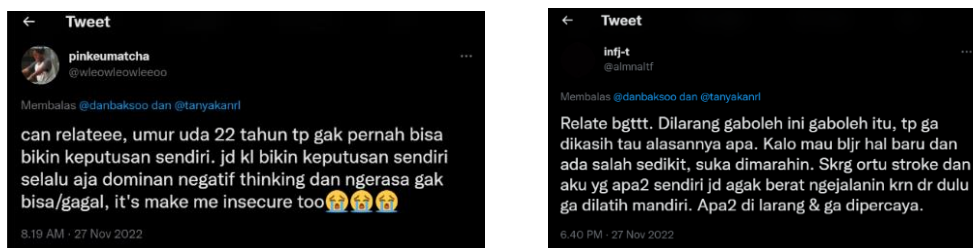
Gambar 1.1 Fenomena Insecure Media Sosial

Sedangkan berdasarkan hasil pra riset di lapangan, seorang informan perempuan berusia 21 tahun yang sudah masuk pada kategori remaja akhir yang mana menurut pendapat Hurlock (2004) bahwa rentang usia remaja akhir adalah 19-21 tahun. Dia tidak memiliki kuasa atas keinginannya. Hal tersebut membentuk ia menjadi individu yang selalu ragu-ragu dalam mengambil keputusan meski dalam hal berskala kecil serta selalu overthinking karena terbayang akan kegagalan. Sedangkan informan lainnya remaja akhir laki-laki yang juga berusia 21 tahun merasa tidak pernah diapresiasi saat berkomunikasi dengan orang tua nya. Hal tersebut membentuk ia menjadi pribadi yang sulit untuk membangun komunikasi dengan orang lain.