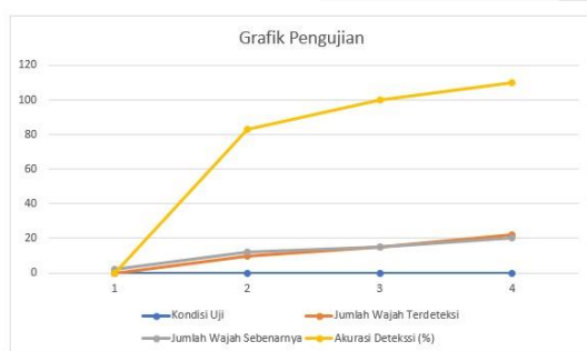
GRAFIK 1. Pengujian

Pada tahap implementasi, sistem deteksi wajah menggunakan Cascade Classifier berhasil melakukan deteksi wajah manusia dengan akurasi yang tinggi. Hasil deteksi wajah ditampilkan dalam bentuk kotak pembatas yang mengelilingi wajah pada gambar/video yang diambil oleh kamera Raspberry NoIR. Berbagai kondisi pencahayaan, posisi wajah, dan ekspresi wajah telah diuji, dan sistem mampu mengenali dan mendeteksi wajah dengan baik.