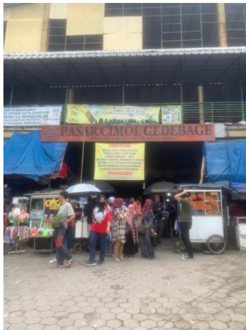
Gambar 1. 2 Pasar Gede Bage Bandung

Thrifting menjadi peluang usaha bagi para pelakunya, oleh karena itu pasar barang bekas tidak hanya diburu oleh konsumen terakhir, tetapi juga oleh pelaku usaha yang menjual kembali barang yang dibelinya. Tidak jarang barang bekas yang dijual merupakan barang layak pakai meskipun dengan kondisi yang kurang sempurna. Beberapa pelaku seni juga turut andil dalam trend ini, dibuktikan denganbanyaknya thrift shop yang melakukan reworking pada pakaian bekas agar tetap memiliki nilai lebih.