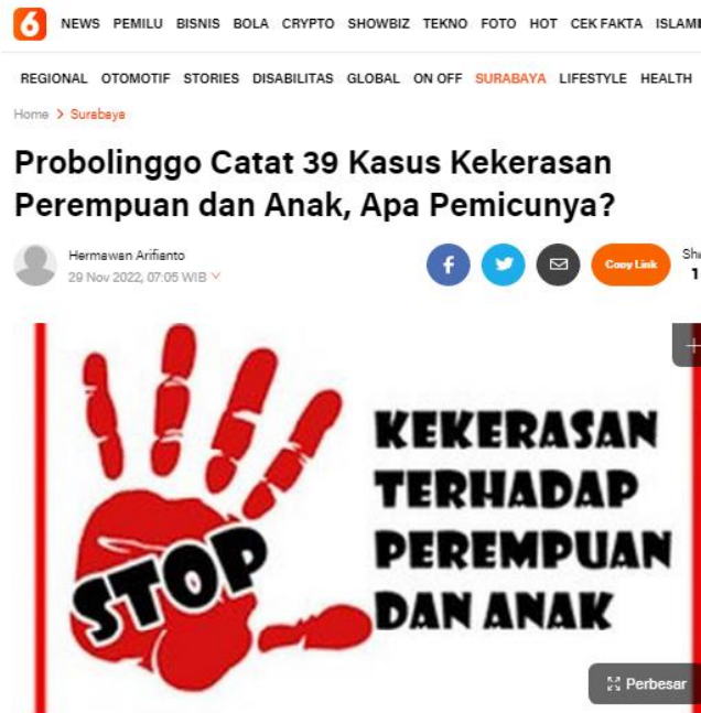
Gambar 1.4 Probolinggo Catat 39 Kasus Kekerasan Perempuan dan Anak

terhadap perempuan yang sering terjadi biasanya bersifat kekerasan seksual, fisik, dan psikologis.