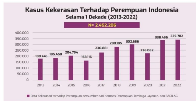
Gambar 1.1 Data Kekerasan Terhadap Perempuan Indonesia