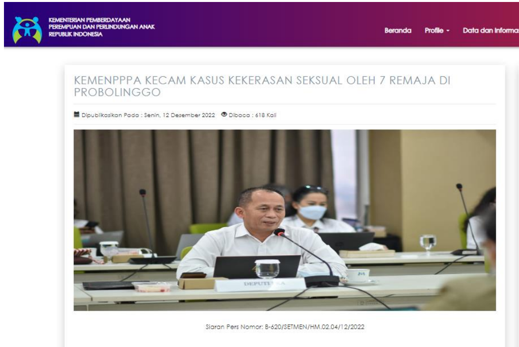
Gambar 1.3 KEMENPPPA Kecam Kasus Kekerasan Seksual

Namun, di penghujung tahun 2022, Probolinggo, sebuah kota di Jawa Timur, menjadi pemberitaan karena viralnya kasus tujuh remaja berusia 18-22 tahun yang melakukan kasus kekerasan seksual atau pemerkosaan terhadap perempuan di bawah umur secara bergilir. Atas kasus tersebut, Kementerian PPPA mengkritisi 7 remaja tersebut karena untuk segera ditindak dan diproses sesuai dengan peraturan perundang-undangan yang berlaku guna menimbulkan efek jera.