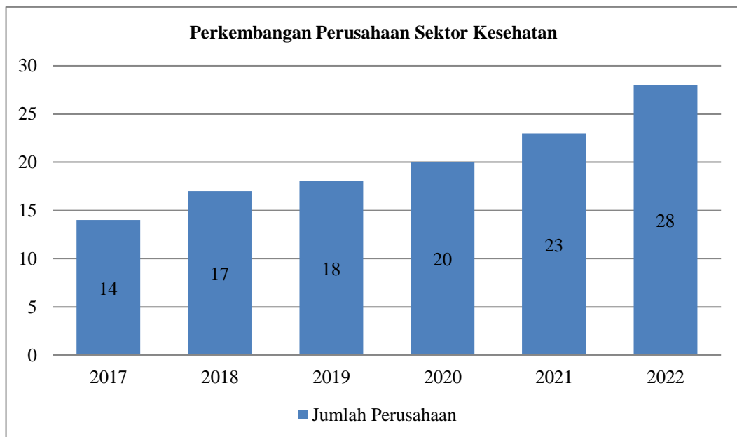
Gambar 1.1 Perkembangan Perusahaan Sektor Kesehatan yang Terdaftar di BEI Tahun 2017-2022

Perusahaan sektor kesehatan akan mudah mendapatkan tambahan pendanaan eksternal apabila menjadi perusahaan go public pada Bursa Efek Indonesia. Berikut grafik yang menunjukkan perkembangan perusahaan sektor kesehatan yang sudah go public serta terdaftar di BEI selama tahun 2017-2022: