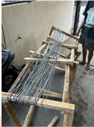
Gambar 3 Pelilitan Kabel

Setelah pelilitan kabel selesai dilanjutkan dengan membuat ranting pohon dengan menggunakan kawat dengan cara kawat dipotong menjadi beberapa bagian dengan panjang yang sama lalu potongan kawat diputar satu arah agar menyatu. Dikarenakan kawat merupakan salah satu limbah dari banyaknya teknologi yang akan dibuat oleh manusia nantinya maka dari itu penulis memilih kawat sebagai ranting pohon. Setelah kawat dibentuk menjadi satu, kawat ditempel ke atas pondasi yang sudah dililit oleh kabel.