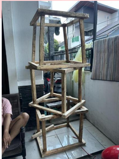
Gambar 2 Pembuatan pondasi

Dan pada tahap produksi dilakukannya proses pembuatan karya yang dimulai dari pembuatan pondasi pohon dari kayu, untuk membuat pondasi kayu dipotong menjadi banyak bagian yang berukuran 64 - 67 cm, lalu digabungkan menjadi kubus menggunakan paku dan disusun keatas seperti yang terlihat di sketsa. Maksud dari penggunaan kayu sebagai pondasi di dalam karya ini adalah Jika distopia terjadi akibat deforestasi kemungkinan populasi pohon akan menurun bahkan hilang dan menyisakan kayu bekas maka dari itu penulis memilih kayu sebagai fondasi untuk pohon distopia.