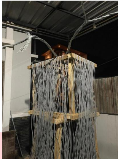
Gambar 5 Penempelan Ranting Kawat

Setelah kawat ditempel dibagian atas pondasi lalu dilanjutkan dengan pemasangan bohlam di bagian dalam pondasi dan di beberapa ranting. Setelah itu bohlam diberi perintah menggunakan arduino yang sudah diprogram agar bohlam menyala bergantian dari bawah ke atas. Tujuan dari bohlam yang menyala bergantian ialah untuk memperlihatkan bahwa pohon itu hidup dan bohlam yang berada diranting kawat d