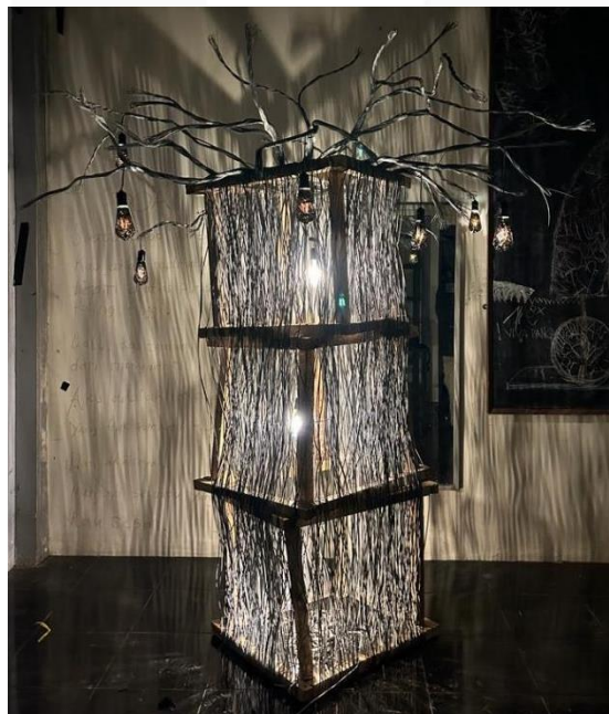
Gambar 8 Hasil Karya