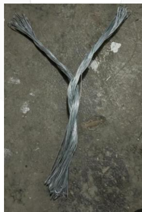
Gambar 4 Pembuatan Ranting dari Kawat

Setelah pelilitan kabel selesai dilanjutkan dengan membuat ranting pohon dengan menggunakan kawat dengan cara kawat dipotong menjadi beberapa bagian dengan panjang yang sama lalu potongan kawat diputar satu arah agar menyatu. Dikarenakan kawat merupakan salah satu limbah dari banyaknya teknologi yang akan dibuat oleh manusia nantinya maka dari itu penulis memilih kawat sebagai ranting pohon. Setelah kawat dibentuk menjadi satu, kawat ditempel ke atas pondasi yang sudah dililit oleh kabel.