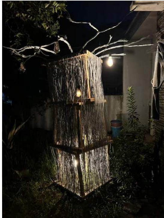
Gambar 7 Hasil Karya