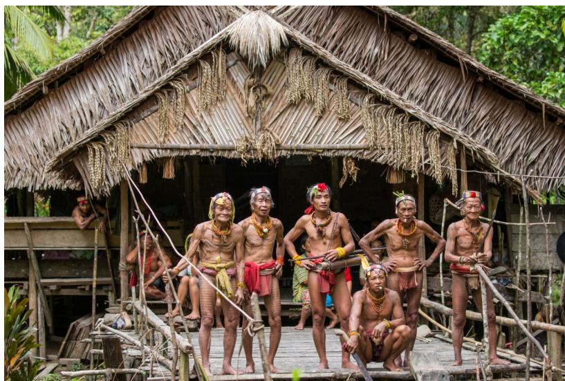
Gambar 1.1 Tradisional Tattoo Mentawai

Suku Mentawai memiliki tradisi turun menurun yang sampai saat ini tetap dipertahankan, salah satunya yang unik adalah tattoo Mentawai, seni rajah tertua di dunia. Tattoo oleh suku Mentawai dinobatkan sebagai tattoo tertua di dunia. Keberadaan seni lukis di atas kulit ini bahkan lahir lebih dulu dibandingkan tattoo Mesir yang baru dimulai 1300 SM. Dalam tradisi suku Mentawai, objek seperti batu, hewan, dan tumbuhan harus diabadikan di tubuh karena dianggap berfungsi untuk menyeimbangkan alam, karena suku Mentawai menganggap semua makhluk memiliki jiwa. Tak seperti proses pembuatan tattoo modern yang menggunakan jarum elektrik, tattoo Mentawai dilukiskan dengan menggunakan alat yang dinamai lilipat patitik. Alat tersebut berupa dua buah kayu, satu dengan jarum, dan satu lagi untuk pemukul. Tattoo Mentawai tak digambar sembarangan, karena mewakili identitas diri mengenai tanah asal dan status sosial. Fungsi lain dari tattoo adalah untuk ekspresi seni, sehingga masyarakat suku Mentawai menato tubuh sesuai kreativitas masing-masing (Lost, 2021).