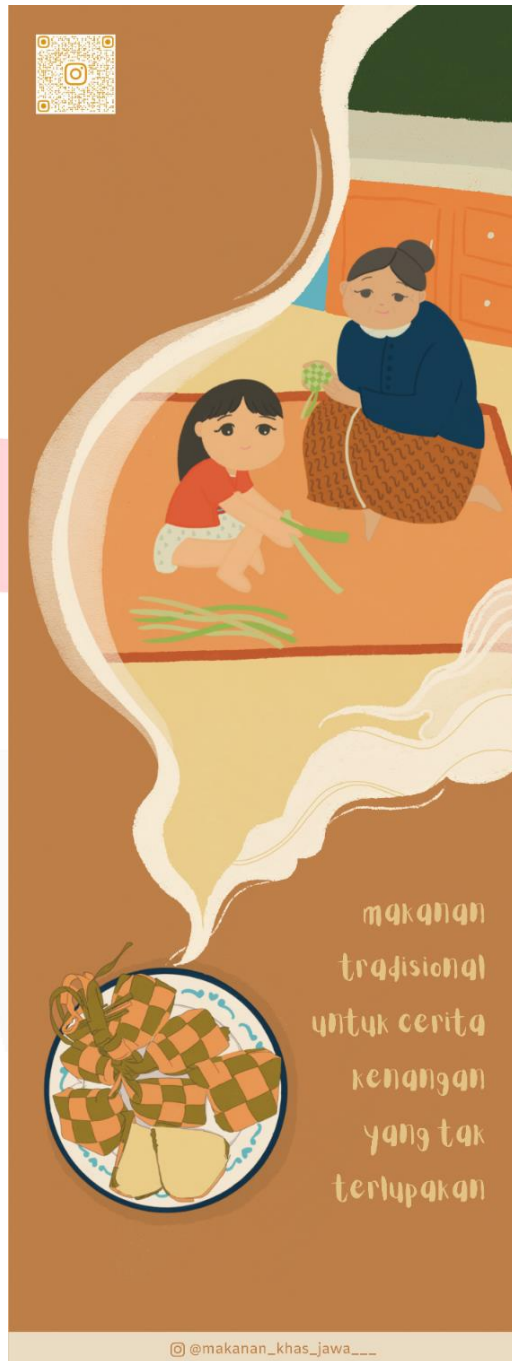
Gambar 4.2 Hasil Perancangan 2