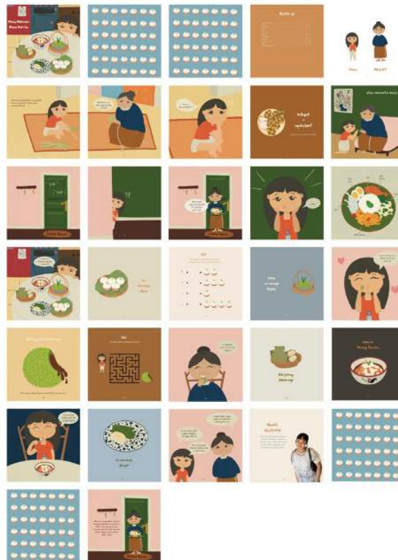
Gambar 4.1 Hasil Perancangan 1