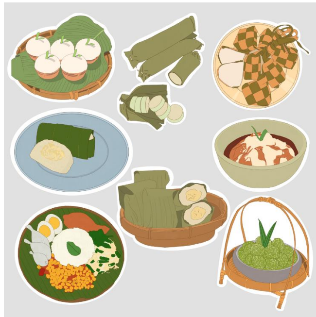
Gambar 4.4 Hasil Perancangan 4