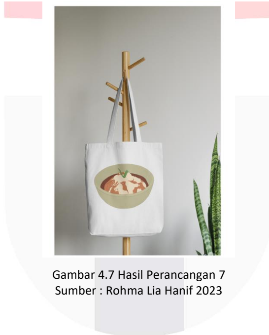
Gambar 4.7 Hasil Perancangan 7