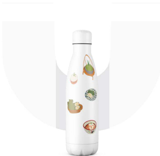
Gambar 4.5 Hasil Perancangan 5