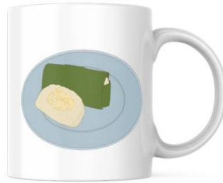
Gambar 4.6 Hasil Perancangan 6