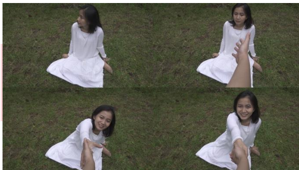
Gambar 11. Screenshot Cuplikan "Deep End"

Masalah akan terus datang dan berbagai cara untuk menyelesaikannya dengan memendam emosi, memendam emosi terus menerus bisa membuat emosi itu suatu hari membludak sehingga bisa menyakiti orang lain. Disini penulis menampilkan dengan ia berlari lalu terjatuh dan menangis yang mengartikan ia terburu-buru menyelesaikan masalah tersebut sehingga ia terjatuh lalu ia merasakan putus asa.