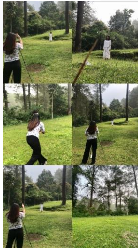
Gambar 4. Proses Produksi

Setelah paska produksi sudah dilakukan dan penulis merasa sudah tepat, penulis akan melanjut ke tahap produksi. Syuting yang dilakukan pada tanggal 5 Juni 2023. Produksian film eksperimental ini dilakukan di outdoor yaitu salah satu lahan kosong yang berada di Cikole Forest Lembang. Karya ini akan dimainkan oleh satu talent perempuan. Proses syuting dibantu oleh beberapa crew dan dibutuhkan lima jam selesai kerja karena kendala cuaca yang cepat berganti.