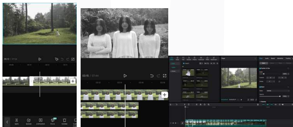
Gambar 6. Proses Editing