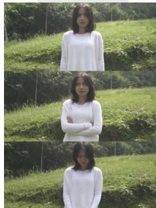
Gambar 8. Screenshoot Cuplikan "Deep End"

Setiap scene mempunyai arti yang berbeda, seperti scene pertama pengambilan teknik kamera dengan wide shot. Talent berada di posisi tengah-tengah frame yang dimana terlihat semua ruang tersebut dan talent akan terlihat kecil dengan ruang yang luas. Scene ini mengartikan bahwa ia benar-benar kesepian dan melihatkan suasana yang sunyi. Selain itu talent berakting seolah-olah melihat sekitar, yang dimana mengartikan bahwa ia tidak memiliki arah dan bingung dengan apa yang harus ia lakukan.