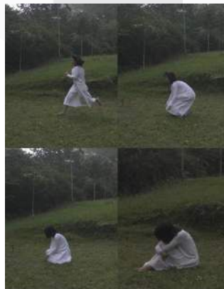
Gambar 10. Screenshot Cuplikan "Deep End"

Di dalam film ini talent berakting berjalan lalu terduduk, mengartikan bahwa setiap manusia memiliki masalah semasa hidupnya, dan berbeda-beda cara orang untuk menyelesaikan masalahnya. Talent berjalan mengartikan bahwa dirinya sedang terburu-buru menyelesaikan masalah nya dengan cara memendam emosi lalu terduduk dimana ia merasa bahwa masalah tersebut sudah selesai.