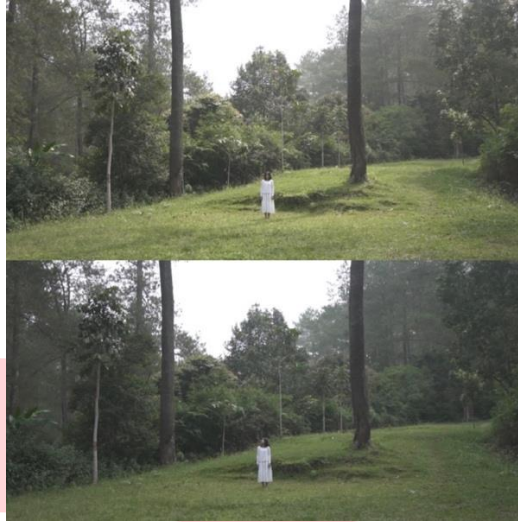
Gambar 7. Screenshoot Cuplikan "Deep End"

Setiap scene mempunyai arti yang berbeda, seperti scene pertama pengambilan teknik kamera dengan wide shot. Talent berada di posisi tengah-tengah frame yang dimana terlihat semua ruang tersebut dan talent akan terlihat kecil dengan ruang yang luas. Scene ini mengartikan bahwa ia benar-benar kesepian dan melihatkan suasana yang sunyi. Selain itu talent berakting seolah-olah melihat sekitar, yang dimana mengartikan bahwa ia tidak memiliki arah dan bingung dengan apa yang harus ia lakukan.