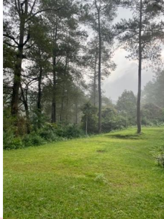
Gambar 3. Tempat Syuting