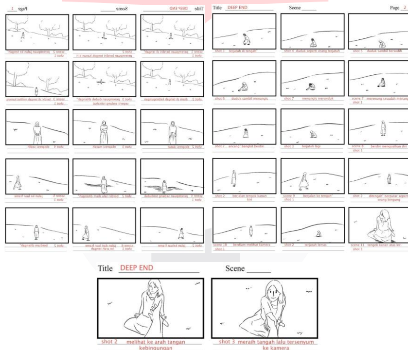
Gambar 1. Storyboard