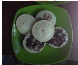
Variasi Rasa Surabi