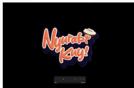
Animatic Storyboard Animasi 2D yang berjudul “Nyrabi Kuy!”

Tahap perancangan terakhir yang penulis lakukan adalah perancangan animatic storyboard .