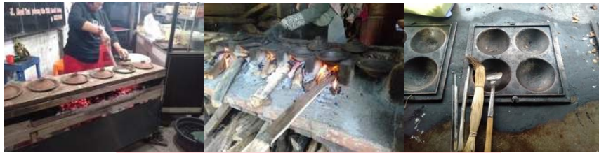
Peralatan Pemasakan Surabi