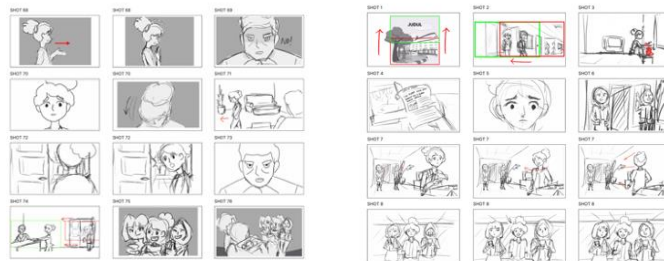
Thumbnail Animasi 2D yang berjudul “Nyrabi Kuy!”

Pada tahap awal penulis memvisualisasikan cerita dan mengeksplor berbagai adegan ke dalam beberapa alternatif gambar berdasarkan script.