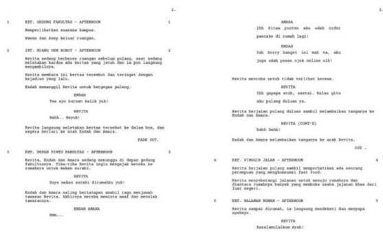
Script Animasi 2D yang berjudul “Nyrabi Kuy!”

Berdasarkan dari diagram The Act Structure , act I bercerita tentang revita mengajak teman-temannya untuk mengikuti festival, plot point 1 ketakutakan Revita dan teman-temannya untuk meminta izin kepada pak rektor kampus, act II