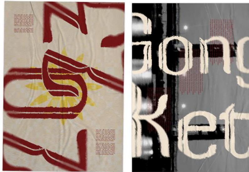
Gambar 5 Contoh Media Pendukung Cetak