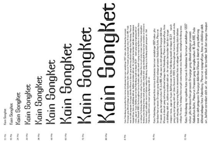
Gambar 6 Showcase Anatomi Huruf