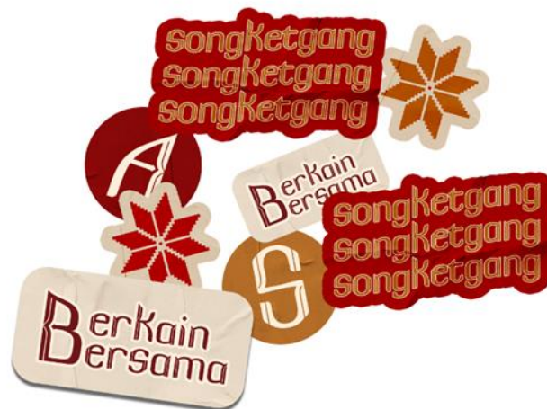
Gambar 8 Contoh Media Pendukung berupa Merchandise