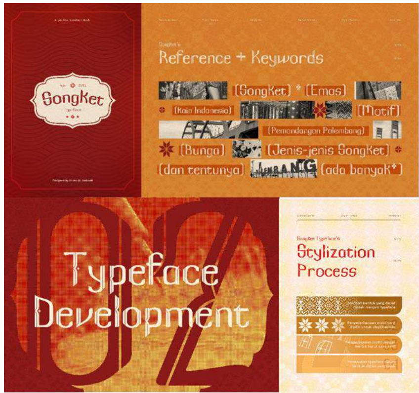
Gambar 7 Type Specimen Book Songket Palembang