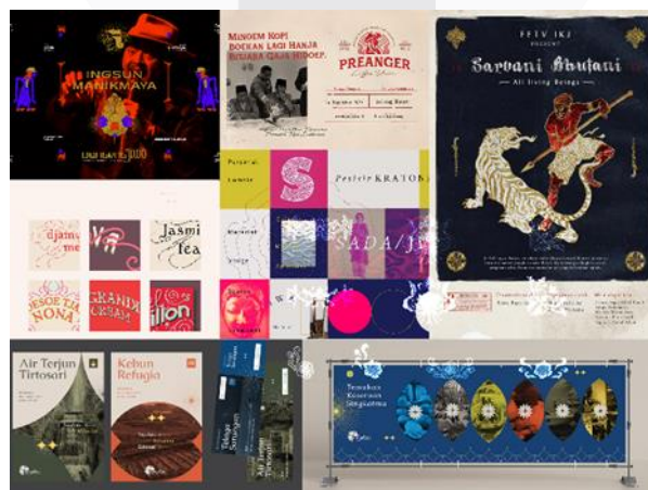
Gambar 1 Inspirasi Look and Feel Perancangan Media

Penggunaan keywords ini membantu untuk filtrasi media dan visual yang diinginkan pada perancangan. Dalam hal ini, media utama akan berpusat pada type specimen book dan media pendukung yang terbagi menjadi media pendukung cetak (Poster, Pamphlet, Sticker Pack) dan digital (post media sosial, diantaranya: Instagram (Feeds, Story, Reels), Behance Post, dan LinkedIn Post). Lalu penentuan visual pun menurun menjadi 3 bagian, yakni (1) Look and Feel, (2) Color System, (3) Type System.