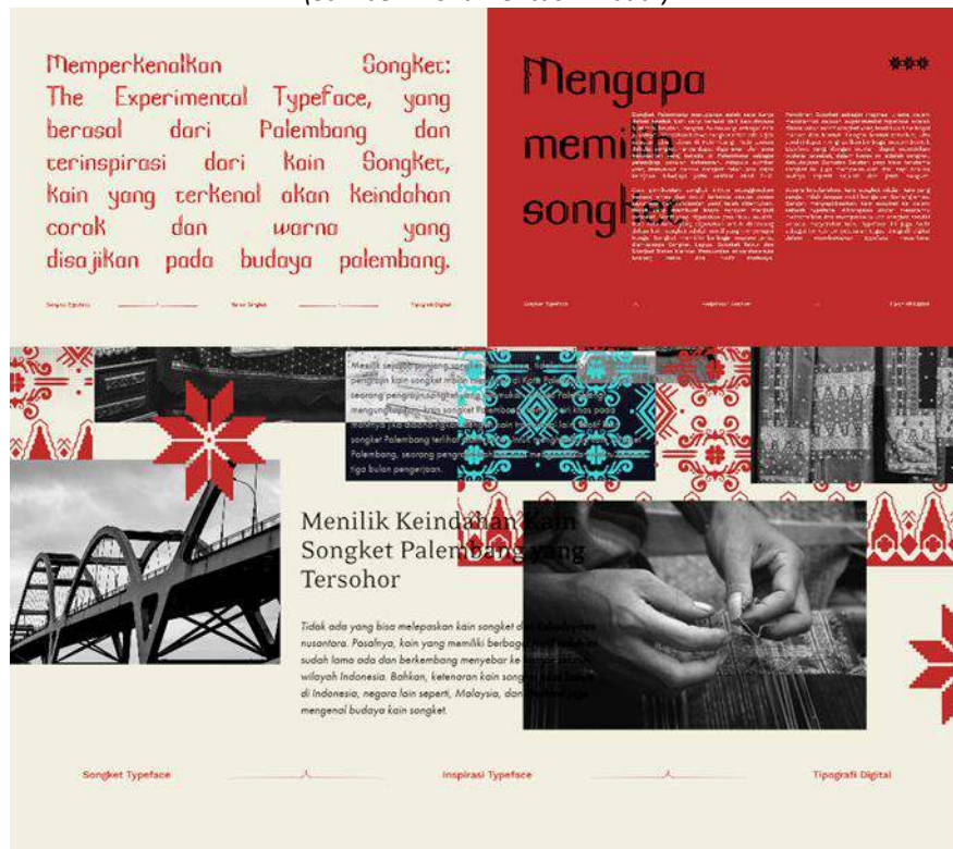
Gambar 6 Contoh Media Pendukung Digital