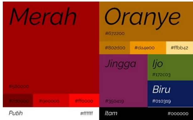
Gambar 2 Color Palette Perancangan