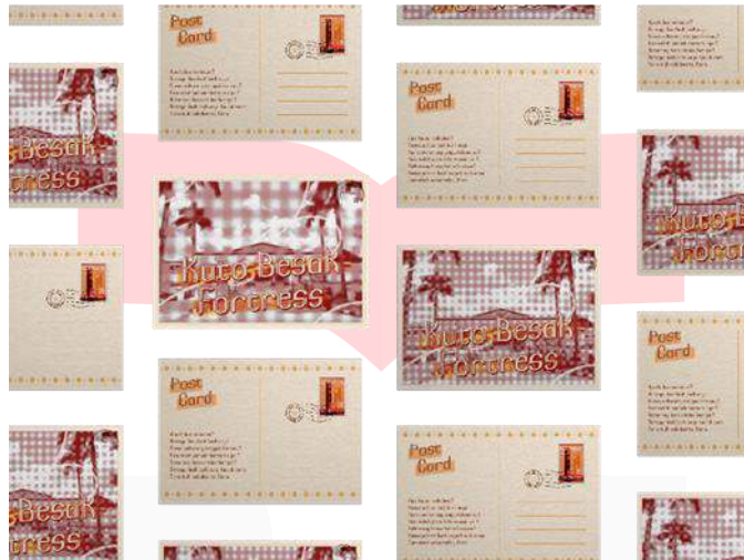
Gambar 7 Showcase Implementasi Font