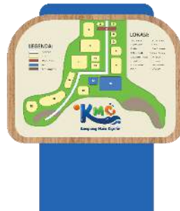
Gambar 9 Site Map