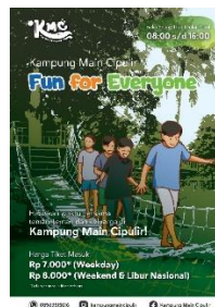
Gambar 14 Brosur