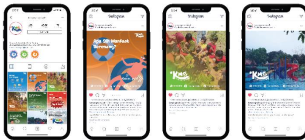
Gambar 16 Sosial Media (sumber: dokumentasi pribadi)