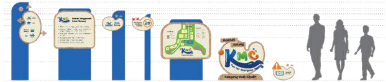
Gambar 10 Perbandingan Ukuran Signage