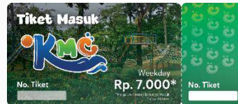
Gambar 12 Tiket Masuk