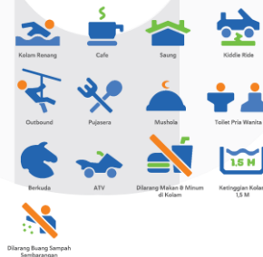
Gambar 3 Hasil Perancangan Pictogram