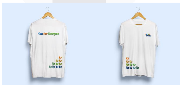
Gambar 15 Kaos