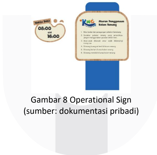
Gambar 8 Operational Sign