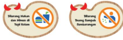
Gambar 6 Warning Sign Kampung Main Cipulir