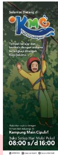
Gambar 13 Banner