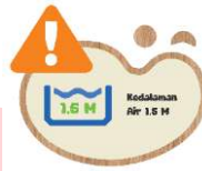
Gambar 7 Regulatory Sign Kampung Main Cipulir