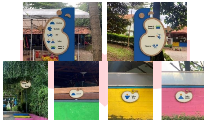
Gambar 11 Pengaplikasian rancangan signage