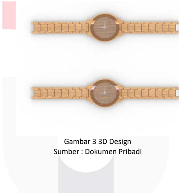
Gambar 3 3D Design