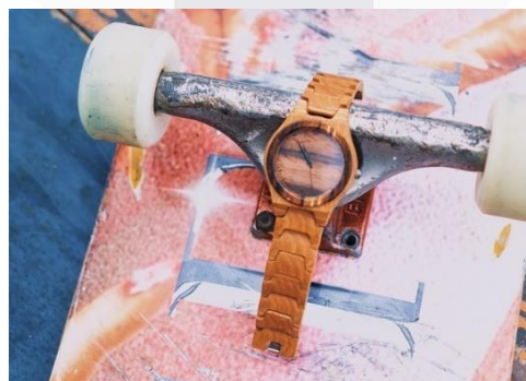
Gambar 4 Prototype