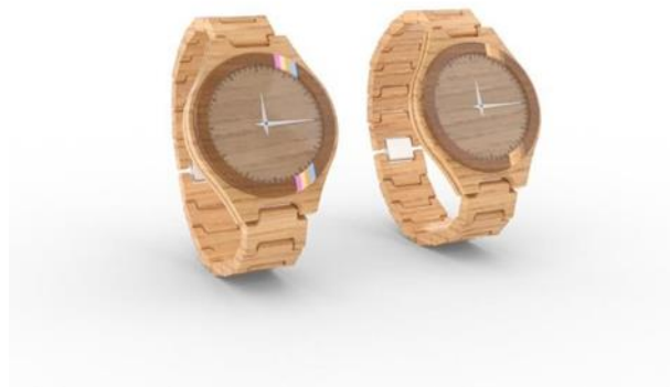
Gambar 2 3D Design