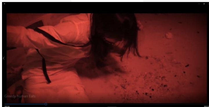
Gambar 3 Pergerakan kamera yang tidak stabil pada film

Pergerakan kamera yang tidak stabil atau handheld dapat menciptakan rasa keterlibatan yang lebih besar bagi penonton. Hal ini dapat memberikan pengalaman yang lebih mendalam terhadap perasaan dan pengalaman karakter perempuan yang mengalami kekerasan.