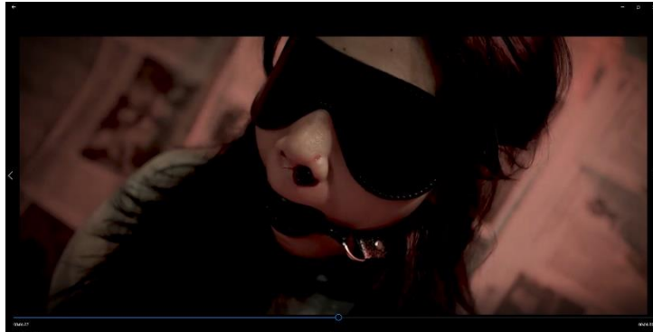
Gambar 4 Close up pada film

yang dirasakan oleh korban. Detail-detail ini dapat menjadi sangat kuat dalam menggambarkan rasa sakit, trauma, atau ketidaknyamanan.