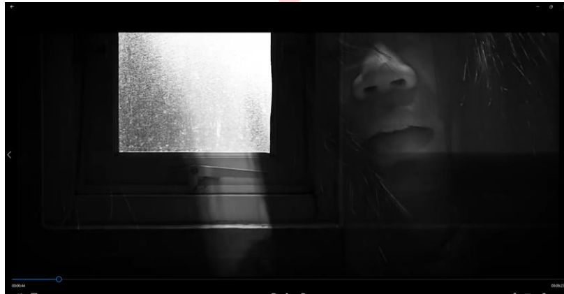
Gambar 7 Transisi Kreatif

Penggunaan transisi visual yang unik dan kreatif antara adegan-adegan dapat membantu menggambarkan peralihan emosi atau pengalaman karakter.