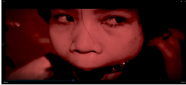
Gambar 6 Montase film