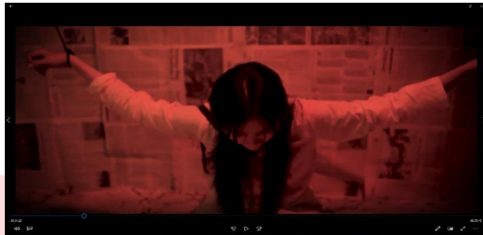
Gambar 2 Penggunaan warna pada film

kesan kesedihan, ketidaknyamanan, atau ketegangan. Pemilihan warna yang kontras dapat membantu menyoroti elemen penting dalam adegan