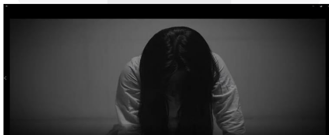
Gambar 1 Pencahayaan kontras yang tinggi pada film

Penggunaan pencahayaan yang dramatis dengan kontras tinggi dapat menciptakan suasana yang tegang dan intens. Teknik ini dapat membantu menyoroti ketidaksetaraan kekuasaan dan perasaan terkekang yang dialami oleh korban kekerasan perempuan.