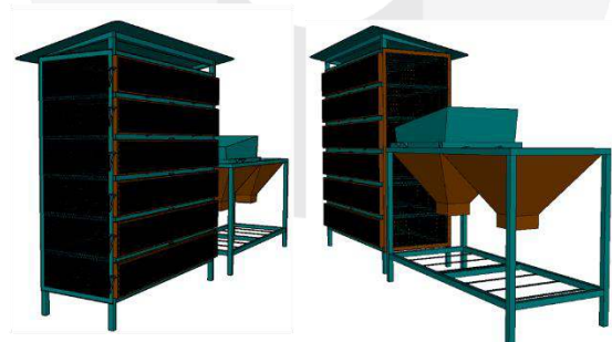
Gambar 2 Desain akhir

Berikut merupakan tampak dari desain akhir yang akan diproduksi dengan memperhatikan aspek yang telah dijelaskan pada Tabel 1 tentang studi kebutuhan, analisis aspek sistem dan material pada Tabel 2 dan Tabel 3 perihal analisis aspek ergonomi dan antropometri.