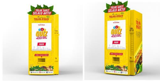
Gambar 2 Visual Vending Machine

Papan reklame atau billboard merupakan media yang sering ditemukan seseorang ketika sedang di luar ruangan. Media ini biasanya ditemukan di persimpangan jalan ketika para pengendara berhenti dikarenakan lampu merah. Ukurannya yang besar menjadi salah satu ciri sehingga dapat mudah dilihat dan ditemukan. Maka dari itu papan reklame ditempatkan di jalan Soekarno-Hatta dan Karapitan, dengan visual vending machine sebagai media utama untuk menarik perhatian target audiens untuk mencobanya.