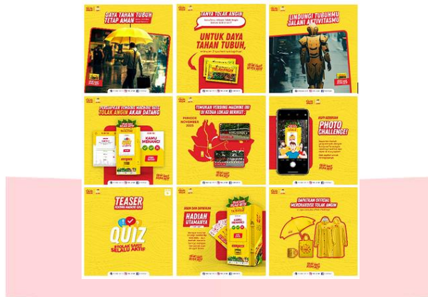
Gambar 9 Visual Poster Digital 1:1

Poster digital dengan orientasi kotak (1:1) digunakan sebagai media yang memiliki informasi lengkap mengenai vending machine , hadiah dan informasi lainnya, ketika target audiens mencari informasi ( search ). Media ini akan diletakan pada sosial media Tolak Angin yaitu pada unggahan Instagram feeds dan Facebook post .