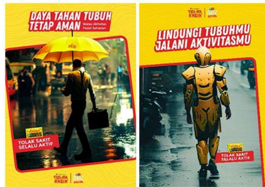
Gambar 4 Visual Poster A3

Untuk meningkatkan atensi lainnya, standing banner juga menjadi salah satu pilihan media visual. Standing banner ini memiliki visual yang berfokus pada informasi hadiah yang diberikan ketika memainkan vending machine yang sebagai media utama. Penggunaan standing banner diletakan berdekatan dengan media utama yaitu vending machine sehingga informasi yang ingin disampaikan kepada target audiens lebih jelas dan tertarik untuk mencobanya.