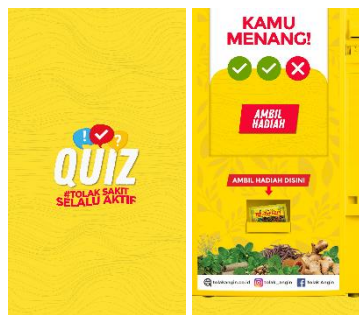
Gambar 8 Visual Teaser

Perancangan teaser ini berformat video dengan orientasi potrait (9:16). Teaser ini dibuat dengan konsep motion graphic dengan memperlihatkan konsumen yang memainkan vending machine dan mendapatkan hadiahnya. Video ini akan disebar luaskan pada Instagram ads , Instagram reels , Youtube short , dan Facebook ads sebagai atensi ( attention ) untuk target audiens agar mereka penasaran dan memiliki keinginan untuk mencobanya.