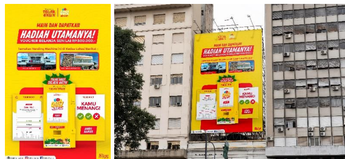
Gambar 3 Visual Papan Reklame

Papan reklame atau billboard merupakan media yang sering ditemukan seseorang ketika sedang di luar ruangan. Media ini biasanya ditemukan di persimpangan jalan ketika para pengendara berhenti dikarenakan lampu merah. Ukurannya yang besar menjadi salah satu ciri sehingga dapat mudah dilihat dan ditemukan. Maka dari itu papan reklame ditempatkan di jalan Soekarno-Hatta dan Karapitan, dengan visual vending machine sebagai media utama untuk menarik perhatian target audiens untuk mencobanya.