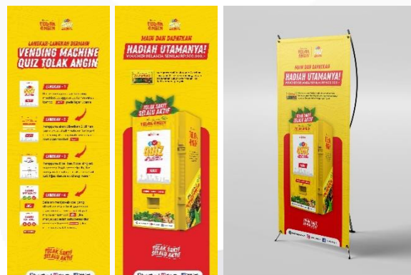
Gambar 5 Visual Standing Banner

Untuk meningkatkan atensi lainnya, standing banner juga menjadi salah satu pilihan media visual. Standing banner ini memiliki visual yang berfokus pada informasi hadiah yang diberikan ketika memainkan vending machine yang sebagai media utama. Penggunaan standing banner diletakan berdekatan dengan media utama yaitu vending machine sehingga informasi yang ingin disampaikan kepada target audiens lebih jelas dan tertarik untuk mencobanya.