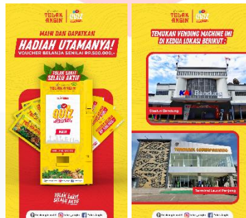
Gambar 7 Visual Poster Digital 9:16

Poster digital potrait (9:16) juga menjadi salah satu media promosi yang akan dibuat. Media ini menjadi salah satu yang sering dilihat oleh target audiens karena ukurannya yang sama dengan ukuran layar handphone sehingga lebih menarik dan mudah untuk dilihat. Penempatan poster digital ini akan disebar pada Instagram story ads .