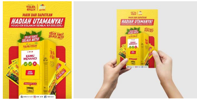
Gambar 6 Visual Flyer

Poster digital potrait (9:16) juga menjadi salah satu media promosi yang akan dibuat. Media ini menjadi salah satu yang sering dilihat oleh target audiens karena ukurannya yang sama dengan ukuran layar handphone sehingga lebih menarik dan mudah untuk dilihat. Penempatan poster digital ini akan disebar pada Instagram story ads .