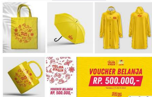
Gambar 10 Visual Merchandise

Merchandise merupakan hadiah yang bisa didapatkan target audiens setelah melakukan serangkaian promosi yang dilakukan. Hadiah tersebut diberikan setelah mereka membagikan ( share ) keseruan atau pengalaman mereka saat memainkan vending machine interaktif. Hadiah seperti googie bag , raincoat , mug dan payung bisa didapatkan ketika mengikuti photo challenge dengan mengunggah kegiatan saat bermain vending machine di sosial media pribadi mereka dan dipilih untuk foto terbaiknya. Sedangkan hadiah berupa voucher dan produk Tolak Angin bisa didapatkan hanya dengan bermain vending machine saja sesuai dengan skor yang diperoleh.