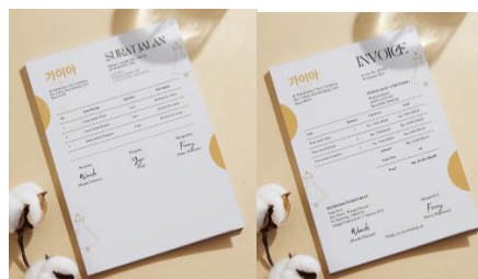
Gambar 8 Surat Jalan dan Invoice