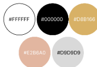
Gambar 1 Color Palette

Dalam proses perancangan dibutuhkan beberapa aset-aset visual seperti, color palette , font, dan aset fotografi. Warna yang akan digunakan ialah menyesuaikan dengan warna yang dimiliki Gaia Designku. Font yang dipilih ialah font sans serif agar memudahkan audiens untuk memahami informasi yang disampaikan. Aset fotografi yang akan digunakan sudah dimiliki oleh Gaia Designku. Berikut aset warna dan font yang diambil.