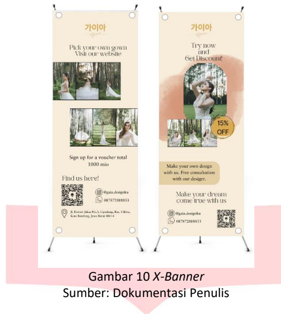
Gambar 10 X-Banner