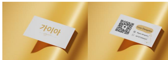
Gambar 5 Mockup Kartu Nama Sumber: Dokumentasi Penulis