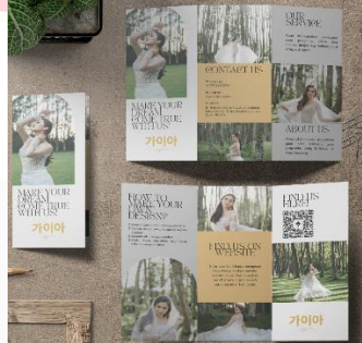
Gambar 6 Mockup Brosur