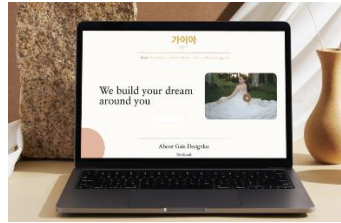
Gambar 4 Mockup Website