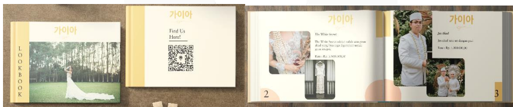
Gambar 7 Mockup Katalog Fisik