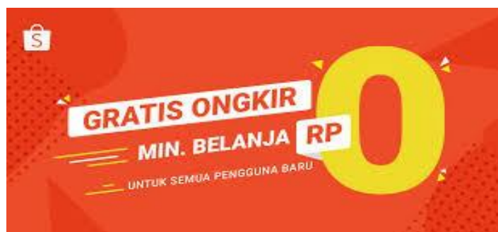
Gambar 1.2 Logo promo diskon ongkir shopee

Shopee menjalankan promosi berdasarkan apa yang sedang populer saat ini. Inovasi yang dimanfaatkan oleh Shopee antara lain free delivery hingga Rp 20.000, limit, cashback, penggunaan brand diplomat, akun Instagram dan Twitter. Shopee memilih Blackpink, Cristiano Ronaldo, Via Vallen, Komeng, dan lainnya sebagai brand Ambassador. Berikutnya adalah kemajuan yang dilakukan Shopee dengan pengiriman gratis, yang dapat dilihat pada Gambar 1.2.