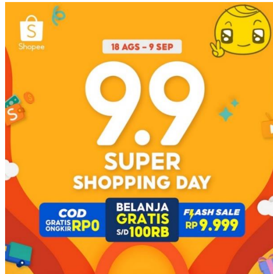
Gambar 1.3 Promo tanggal cantik shopee