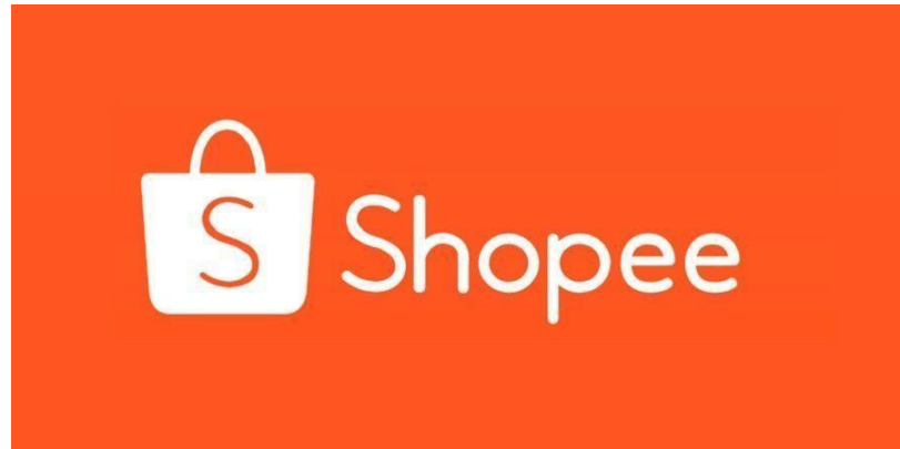
Gambar 1.1 Logo perusahaan