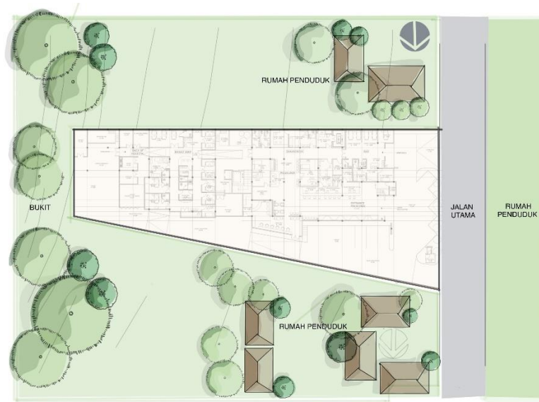
Gambar 1. 1 Siteplan Perancangan

Batasan perancangan pada Klinik Global Sarana Medika merupakan lingkup klinik yang nantinya akan berkembang menjadi rumah sakit tipe C, area Klinik Global Sarana Medika memiliki luas lahan sebesar 10.256 m 2 , luas bangunan sebesar 4390 m 2 , dan lahan terbuka sebesar 8,826 m 2 . Area interior yang akan dirancang ulang minimal memiliki total luasan 803 m 2 .