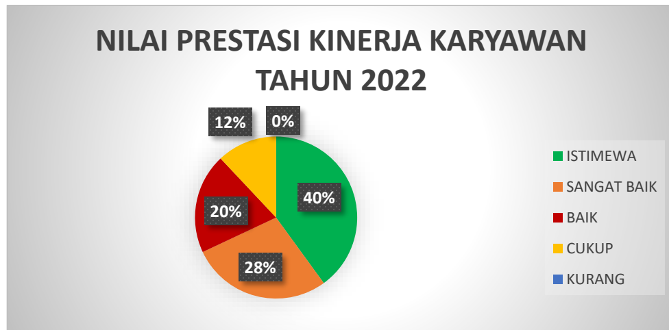
Gambar 1.3 Diagram Nilai Prestasi 2022