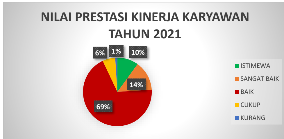
Gambar 1.2 Diagram Nilai Prestasi 2021

Berdasarkan tabel 1.2 rentang nilai kinerja karyawan PT BTN pada Kantor Cabang Cirebon paling bawah dimulai dari kategori kurang dengan rentang nilai 100 – 200. Kemudian dilanjutkan dengan kategori cukup dengan rentang nilai 201 – 300, kategori baik dengan rentang nilai 301 – 380, kategori sangat baik dengan rentang nilai 381 – 450, dan paling tertinggi kategori istimewa dengan rentang nilai 451 – 500.