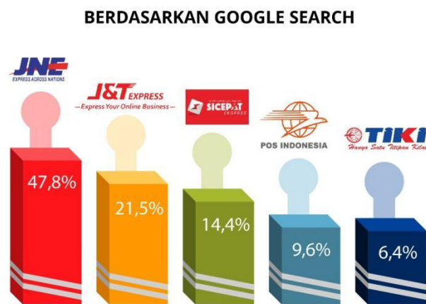
Gambar 1.3 Berdasarkan Google Search

Dalam memberikan pelayanan yang bagus dan sesuai dengan harapan pelanggan, J&T Express dituntut untuk memahami harapan pelanggan serta memberikan pelayanan yang memuaskan. Jika pelanggan merasa puas dengan pelayanan yang diberikan, maka pelanggan akan membandingkan dengan pelayanan dari kompetitor lainnya. Jadi untuk masalah kualitas pelayanan merupakan salah satu bagian yang penting dan perlu mendapat perhatian yang serius bagi J&T Express untuk tetap bisa bersaing dengan kompetitor lainnya. Sebagai perusahaan yang berbasis teknologi, J&T Express akan terus berinovasi agar sistemnya bisa memberikan pelayanan yang maksimal ke pelanggan. Inovasi yang dihadirkan oleh J&T Express adalah pengadaan mesin sortir otomatis yang dapat mensortir paket dengan kecepatan 30.000 paket dengan 108 destinasi.