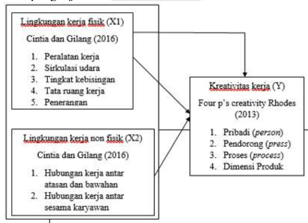
Gambar 2. 1 Kerangka Pemikiran

Berikut kerangka pemikiran atas pengkajian ini: