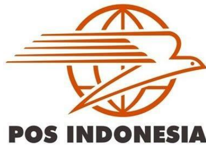
Gambar 1. 1 Logo Kantor Pos Indonesia

Kantor Pos Padang Panjang adalah salah satu cabang PT. Pos Indonesia yang berada di Kota Padang Panjang Dan dengan berkembangnya jaman, Pos Indonesia selalu meningkatkan layanan nya seperti menjadi layanan pengiriman terpercaya, menjadi kekuatan logistik dan E-Commerce Indonesia, mendukung kemudahan akses finansial dan menjadi inovator digital.