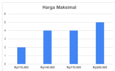
GAMBAR IV.4 Harga maksimal

Hasil dari willingness to pay menunjukkan bahwa terdapat 73% atau 11 responden setuju akan kesesuaian tarif yang akan ditetapkan berdasarkan kualitas layanan, serta 27% atau 4 responden tidak setuju akan kesesuaian tarif yang akan ditetapkan dengan kualitas layanan. Terdapat 67% atau 10 responden setuju dengan keterjangkauan tarif yang akan ditetapkan dan 33% atau 5 responden tidak setuju dengan keterjangkauan tarif yang akan ditetapkan. Terdapat 8 responden menilai bahwa harga minimum yang dapat dikatakan bahwa harga terlalu rendah sebesar Rp80.000,00, 3 responden menilai bahwa harga minimum yang dapat dikatakan bahwa harga terlalu rendah sebesar Rp110.000,00, 1 responden menilai bahwa harga minimum yang dapat dikatakan bahwa harga terlalu rendah sebesar Rp140.000,00, 3 responden menilai bahwa harga minimum yang dapat dikatakan bahwa harga terlalu rendah sebesar Rp170.000,00. Terdapat 2 responden menilai harga maksimal atau harga paling tinggi yaitu sebesar Rp110.000,00, sebanyak 4 responden menilai harga maksimal atau harga paling tinggi yaitu sebesar Rp140.000,00, sebanyak 4 responden menilai harga maksimal atau harga paling tinggi yaitu sebesar Rp170.000,00, dan sebanyak 5 responden menilai harga maksimal atau paling tinggi yaitu sebesar Rp200.000,00.