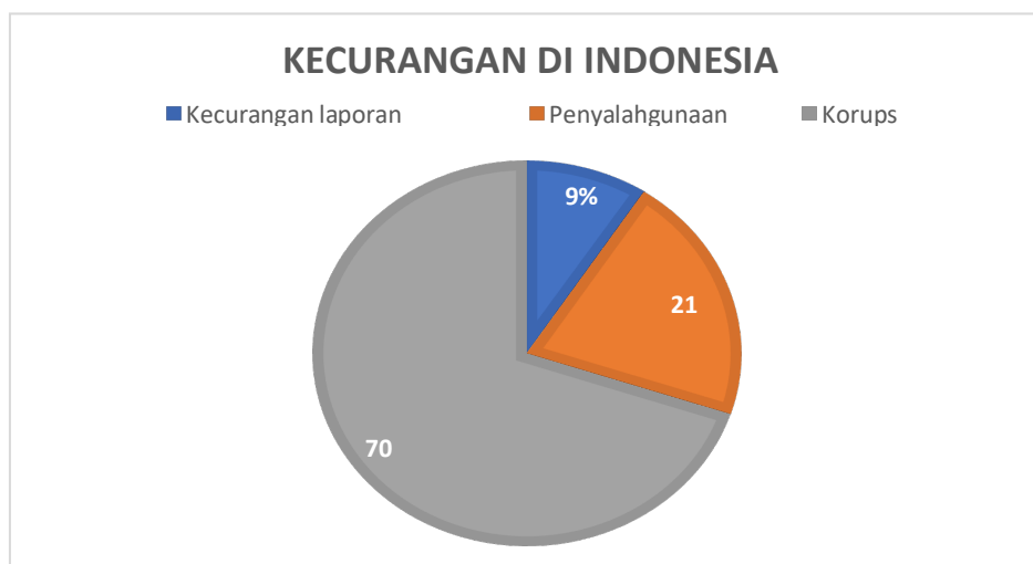
Gambar 1. 2 Kecurangan yang terjadi di Indonesia

Fraud didefinisikan sebagai tindakan ilegal yang dilakukan dengan tujuan untuk menipu dan menghasilkan keuntungan bagi individu atau organisasi (ACFE, 2023). Kecurangan laporan keuangan ini sering terjadi baik di dunia maupun di Indonesia. Di Indonesia memiliki berbagai jenis kecurangan, ada 3 jenis kecurangan yang terjadi di Indonesia ialah kecurangan laporan keuangan, penyalahgunaan aset dan korupsi. Berikut terdapat diagram jenis kasus kecurangan yang terjadi di Indonesia.