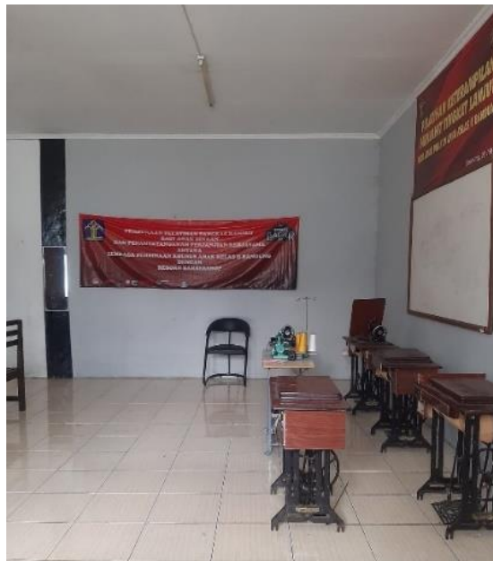
Gambar 1. 3 Ruang menjahit dalam aula LPKA