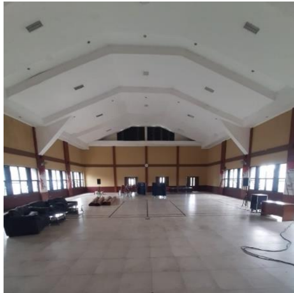
Gambar 1. 2 Tampak dalam Aula LPKA