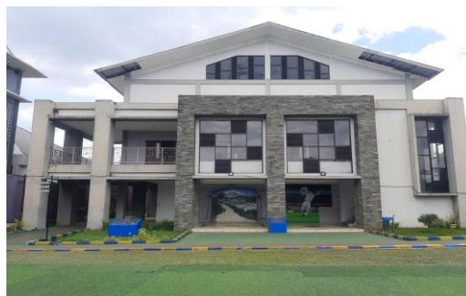
Gambar 1. 1 Tampak fasad Aula LPKA