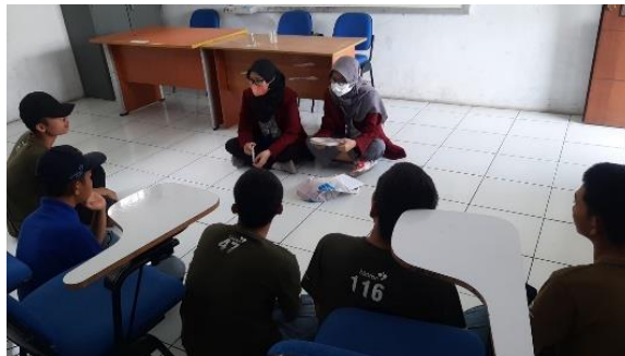
Gambar 1. 5 Wawancara dengan warga binaan anak