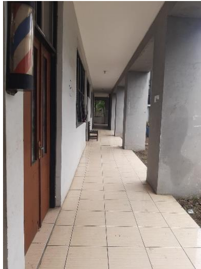
Gambar 1. 4 Koridor lantai 1 aula LPKA