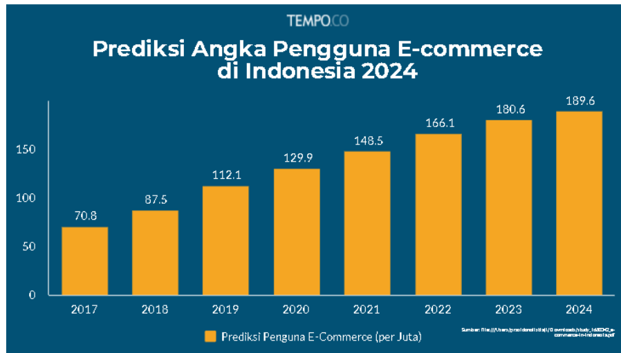
Gambar 1. 2 Prediksi pengguna E-Commerce di Indonesia