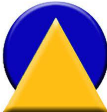
Gambar 1.1 Logo Perusahaan PT. Biro Arsitek & Insinjur Sangkuriang