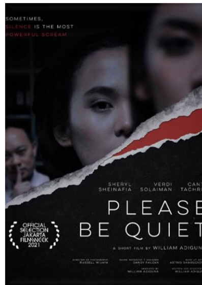
Gambar 1. 2 Poster Film Pendek Please Be Quiet

terlihat di lingkungan tempat kerja. Oleh karena itu, film pendek ini dapat merepresentasikan kekuasaan pada kasus pelecehan seksual di tempat kerja.