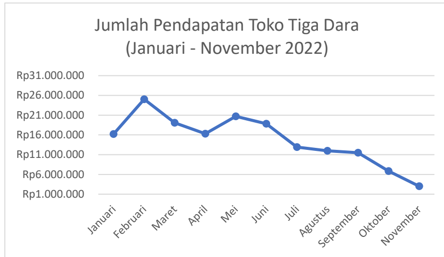
Gambar I. 1 Jumlah Pendapatan Toko Tiga Dara (Januari - November 2022)

Dapat dilihat dari Gambar I.1 bahwa pendapatan yang diperoleh Toko Tiga Dara pada tahun ini cukup tidak stabil dan selama 3 bulan terakhir cenderung terus mengalami penurunan. Berdasarkan hasil wawancara dan observasi langsung dengan pemilik Toko Tiga Dara yang dilakukan pada tanggal 24 November 2022, pemilik memberikan pernyataan bahwa toko ini memiliki proses bisnis yang masih belum optimal padahal proses bisnis yang terjadi di toko ini dapat dikatakan cukup sederhana. Pemilik toko mengatakan salah satu penyebab dari belum optimalnya proses bisnis di toko tersebut yaitu lamanya proses pelayanan yang diberikan kepada pelanggan. Adapun jenis produk alat kebutuhan rumah tangga yang dijual oleh toko ini cukup banyak, namun karyawan yang ada di toko tersebut tidak semuanya hafal dengan harga dari setiap produk yang dijual. Sehingga ketika ada pelanggan yang bertanya mengenai harga dari produk yang ingin mereka beli, karyawan tersebut harus bertanya terlebih dahulu kepada pemilik toko yang mana hal tersebut sangat tidak efektif dan efisien karena karyawan harus berjalan mondar mandir bertanya perihal harga. Bahkan, pemilik toko juga mengatakan bahwa sering kali terjadi perbedaan pernyataan harga yang diberikan antara karyawan dengan pemilik toko tersebut karena karyawan tersebut merasa hafal dengan harga dari produk tersebut yang menyebabkan pelanggan tidak jadi membeli. Selain dari hasil wawancara dengan pemilik toko, didapatkan pula beberapa data keluhan