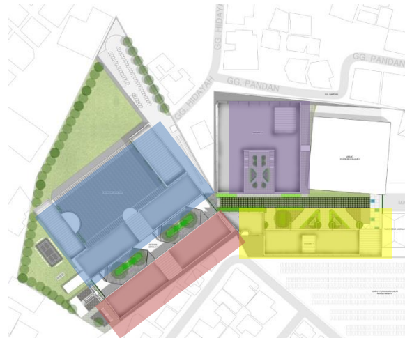
Gambar 1. 1 Bangunan Ma'had Bakkah yang didesain

Dalam perancangan pesantren Ma'had Bakkah memiliki batasan perancangan sebagai berikut: